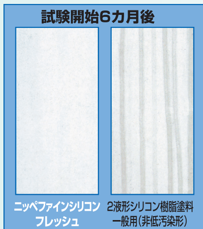
【超低汚染性比較データ】

雨垂れによる汚染などを防止するためには、塗膜表面が水になじむような性質であることが重要です。カーボンなどの汚染物質には油の性質があり、塗膜表面も水をはじくような油の性質(親油性)を持っていると、汚染物質が表面に付着しやすくなります。しかし塗膜表面に水になじむような性質(親水性)があると、油の性質の汚染物質は付着しにくく、降雨時の雨水が汚染物質と一緒に流してしまいます。