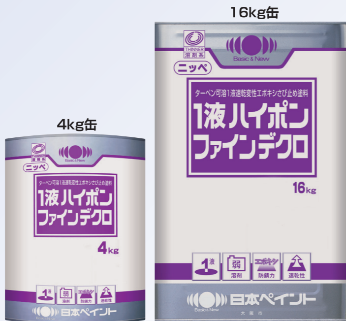
*地域や色相により缶意匠が異なる場合がありますので、あらかじめご了承ください。